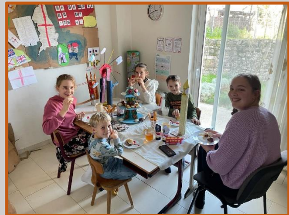
Afsluiting project Engeland met een high-tea