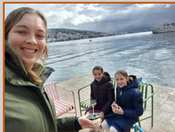
Wie logeert er wel eens bij de juf? Wij wel!